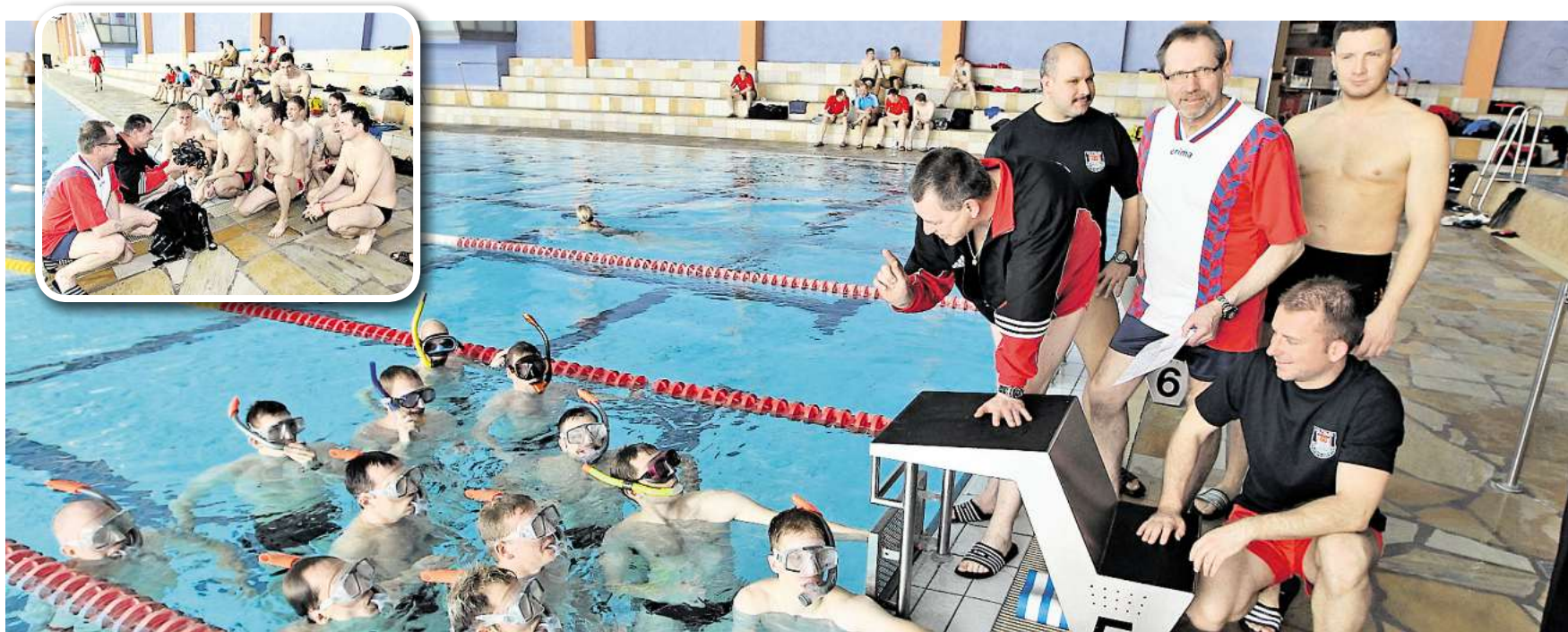
Badeland: Die Tauchanwärter der Berufsfeuerwehr absolvieren eine einjährige Ausbildung.

► Karten sind im Theaterpavillon und an der Abendkasse erhältlich. Das Italienische Kulturinstitut, der Literaturkreis und das Theater setzen mit dieser Lesung ihre gemeinsame Reihe „Begegnungen mit der Literatur“ fort. Das Theater wird wieder einmal zum „Literaturcafé“.